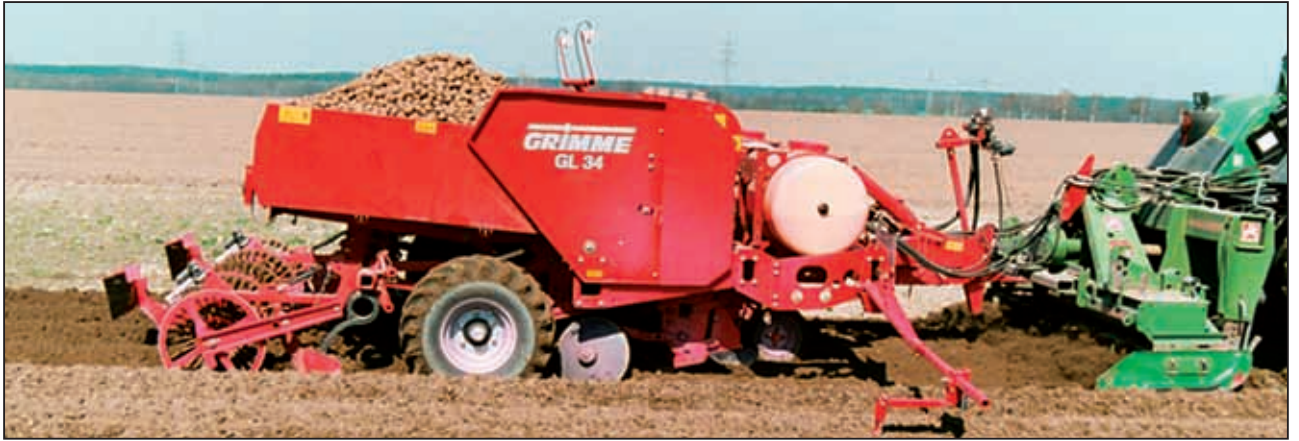
Хорошее рыхление: GL 34 T позади вертикально-фрезерного культиватора с глубокорыхлительными лапами.