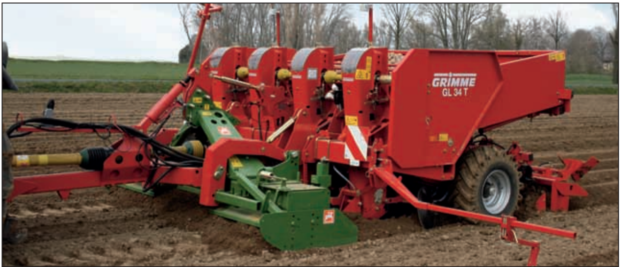
Отличное решение: под дышлом возможна простая установка вертикально-фрезерного культиватора Amazone или Lemken.