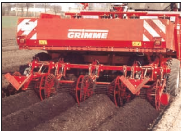
Решение для лёгких почв: картофелесажалка с подпружиненными окучивающими корпусами для формирования гребня – включая отдельноподвешенные, регулируемые решетчатые катки для лёгких почв и лучшие условия для водопоглощения.