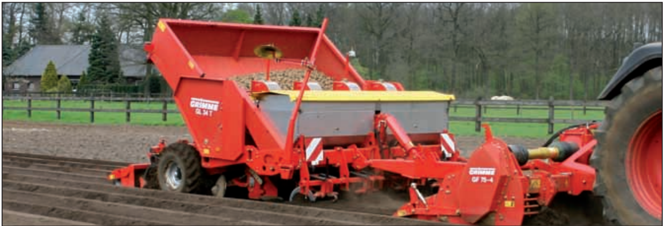
Полная программа для профессионалов: новая «комбинация фрезы-сажалка-5 в 1» выполняет все технологические операции за один проход. Посредством глубокорыхлительных лап с широким лемехом почва разрыхляется на большой глубине – превосходное измельчение комков посредством фрезы.