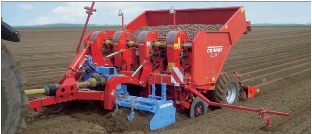
Рабочая глубина регулируется посредством гидравлического цилиндра также, как с почвообрабатывающим агрегатом Grimme. Длина рабочих органов вертикально-фрезерного культиватора составляет 400 мм.