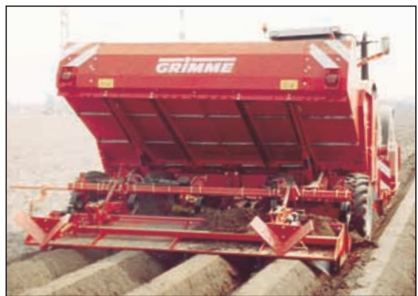
Формирование гребня через большие рыхлительные лапы с гребнеобразующей плитой.